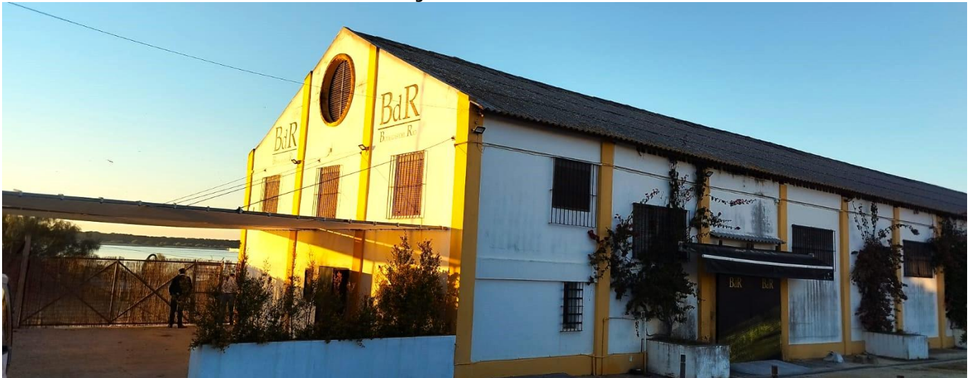
Fachada principal de las Bodegas del Río e Hijos, S.L.