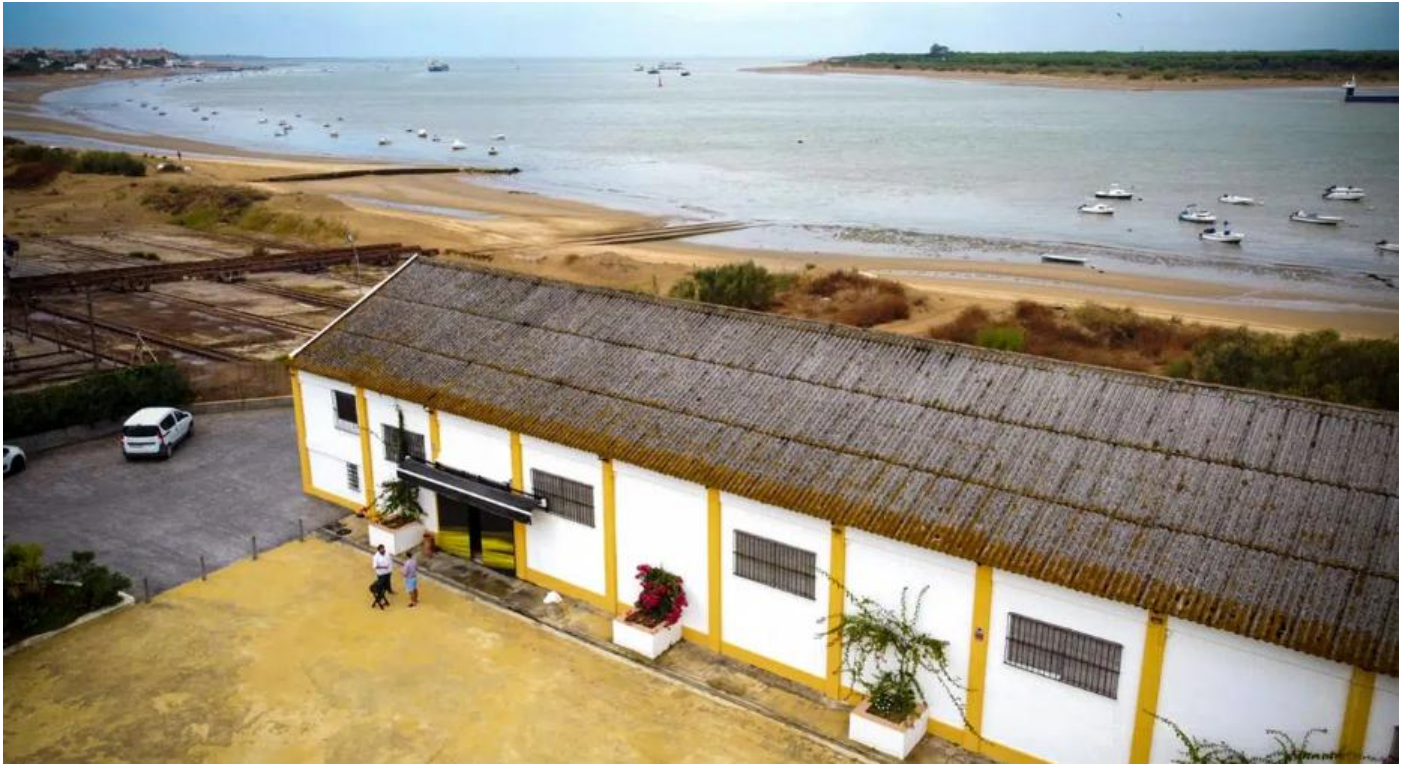
Bodegas del Río. Vista aérea