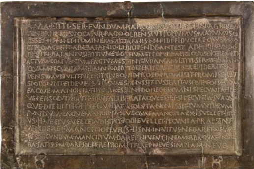
Bronce de Bonanza. Museo Arqueológico Nacional, Madrid