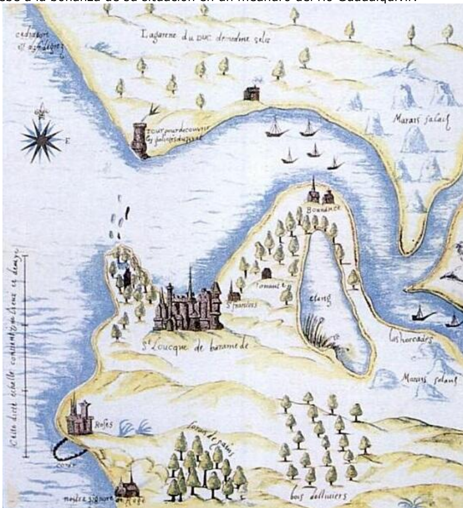
Salinas de Sanlúcar de Barrameda (1599). Samuel de Champlain (1567-1635)

b) Su nombre se debe a la bonanza de su situación en un meandro del río Guadalquivir.